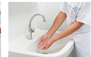
Spoel met water vanaf handpalm