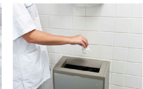
Gooi doekje weg